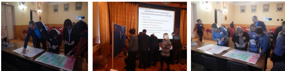
Фото 1. Исследовательская сессия I

В процессе размещения стикеров осуществлялась их группировка: после того, как первый участник разместил свои идеи, следующие участники, при совпадении идей, наклеивали свои стикеры рядом, а если подобных идей не было, то размещали их отдельно.