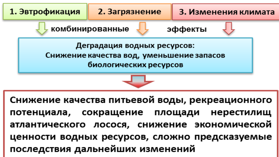
Рисунок 1. Схема причин и последствий изменений водных ресурсов в Арктике

Исследования пресноводных экосистем Евро-Арктического региона за последние десятилетия показали: происходят значимые перестройки в их структурно-функциональной организации, проявляющиеся в изменениях продукционного потенциала гидробионтов, радикальных изменениях в структуре сообществ, явлениях массового развития некоторых видов гидробионтов, инвазиях новых видов и расширении ареала аборигенных.