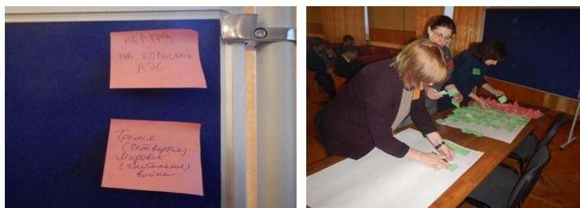
Фото 2. Исследовательская сессия I

На втором этапе мы не проводили определение кластеров как «важных» и «неопределенных», поскольку и важность, и неопределенность кластеров хорошо просматривалась из формулировки «движущих сил», сделанной участниками семинара.