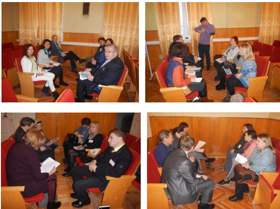
Фото 3. Исследовательская сессия II