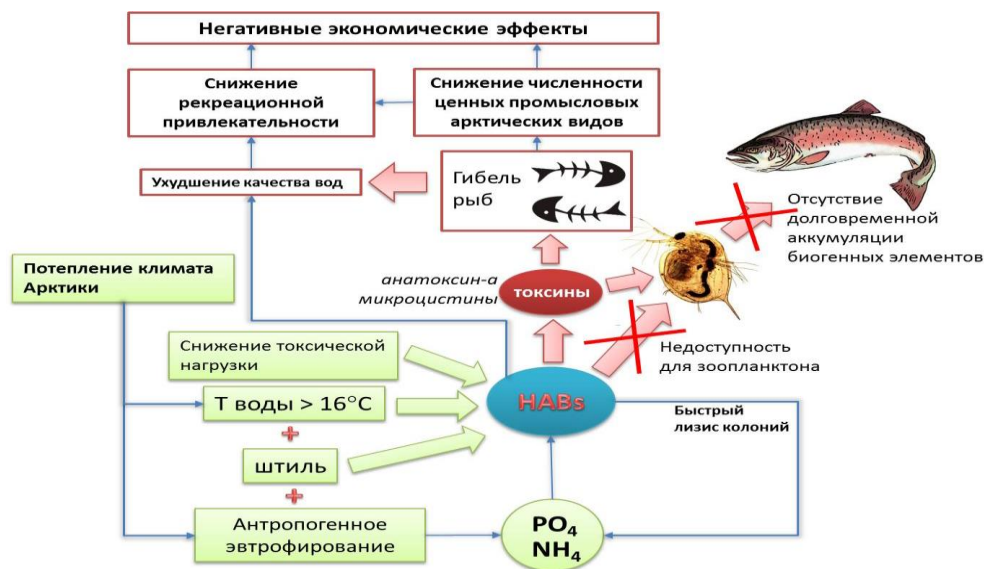
Рисунок 2. Схема причин массового развития цианопрокариот в арктических озерах и его последствия

Повсеместно отмечается снижение доли ценных промысловых видов рыб на фоне увеличения малоценных короткоцикловых представителей ихтиофауны (рис. 3).